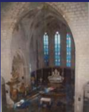
Le chœur : espace sacré de l'église où le prêtre officie devant l'autel.