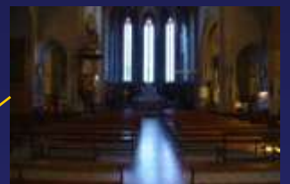
La Nef : partie centrale de l'édifice où prennent place les croyants pour assister à la messe.