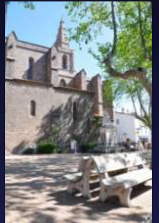
Vue côté Sud

Les bras du transept non saillants se terminent par 2 chapelles.