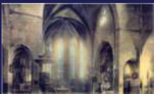
L'abside : Extrémité de l'église où se trouve le chœur

le transept : partie perpendiculaire à la nef qui en plan figure les 2 bras de la croix, elle constitue un espace entre le chœur et la nef.