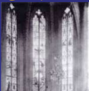
Anciens vitraux Détruits lors de la seconde guerre mondiale